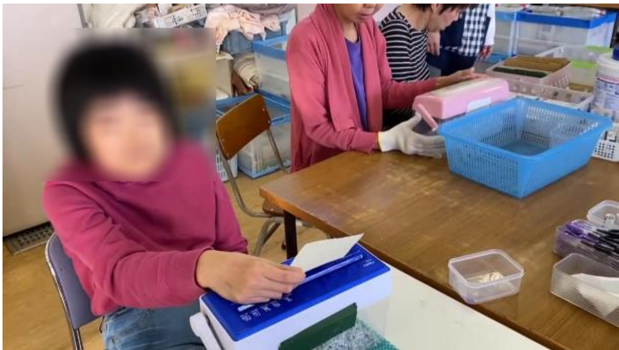
仲間と作業に取り組む