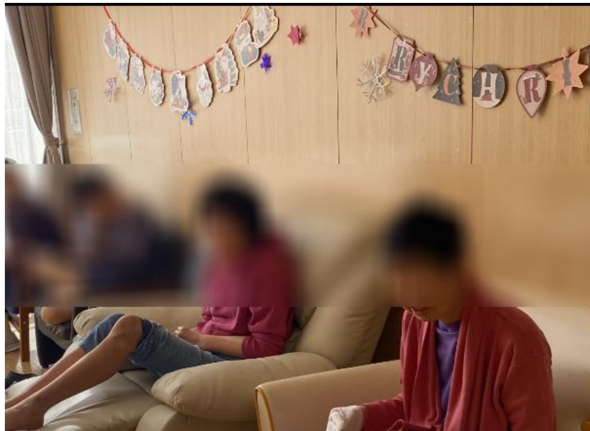
昼食後にデイルームでくつろぐ