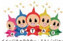
イメージキャラクター：エルレンジャー