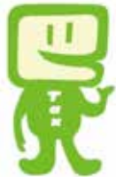
国税庁e-Taxキャラクター イータ君