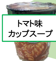
トマト味 カップスープ

インスタントのカップスープも水煮の豆を入れれば栄養価UP！たんぱく質、食物繊維が増量します