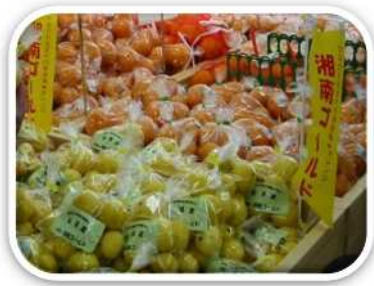
店頭に並ぶ湘南ゴールド (小田原市)

農林水産物の地産地消を拡大するため、ブランド化や流通システムづくりを推進します。