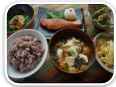
地域の食材を使った献立 (かながわの医食農同源メニュー集より)

個人の体調に合った食の提供やPRを通じて、「未病を改善する」食生活を普及します。