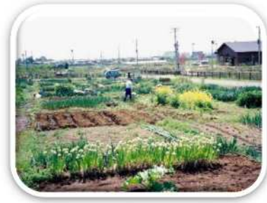
市民農園（小田原市）

農作業などの体験を通じて、心と体をリフレッシュさせ、健康的な生活を送る環境づくりを進めます。