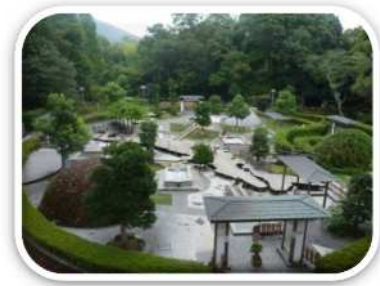
独歩の湯（湯河原町）

効果的な入浴法の提案や、温泉地の「ブランド化」などにより、温泉の持つ魅力を幅広い世代に向けてアピールします。