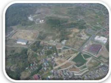
西湘テクノパーク（小田原市）

「未病を改善する」取組みとの連携により、今後大きな成長が見込まれる「未病産業」を中心に産業集積を促進します。