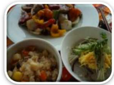
食材の機能性を生かしたメニュー (かながわの医食農同源メニュー集より)