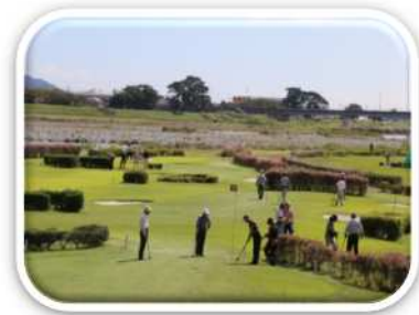
パークゴルフ場（開成町）

地域で盛んなスポーツなどを通じて、様々な年代が気軽に体を動かせる場づくりを進めます。