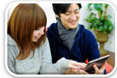
わかりやすい情報発信