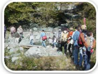
森林浴を楽しむ（松田町）