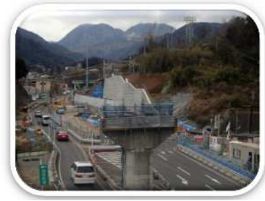
小田原箱根道路の整備

観光地へのアクセス向上など、地域を快適に移動できる交通ネットワークの整備を推進します。