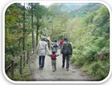
自然と触れ合うウォーキング (松田町)

旧東海道・足柄古道ウォークや歴史探訪まちあるきなど、楽しく歩いて健康になる取組みを推進します。