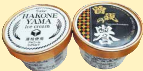
「HAKONEYAMA」(左)と「曾我の誉」(右) 1個 340円 アルコール0.2%