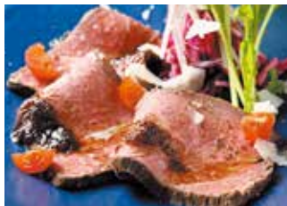
うかい特選牛ローストビーフ

📍 足柄下郡箱根町仙石原 940-48 ☎ 0460-86-3111 🕒 10:00～17:30(入館は17:00まで) 料 大人1,800円ほか 🗓 2023年1月10日(火)～1月20日(金)