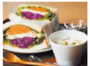
たっぷり野菜のがんとサンドセット

📍 足柄下郡湯河原町宮上 623-1 ☎ 0465-63-7788 🕒 9:00～16:30(カフェは10:00～/入館は16:00まで) 料 大人600円ほか 🗓 水曜(祝日の場合開館、翌平日休館)、年末・展示替え期間等(事前にご確認ください)