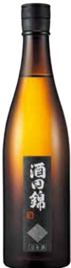
酒田錦 純米 720ml 1,650円