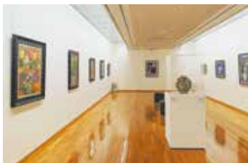
画伯の迫力ある絵をじっくり鑑賞できる

真鶴町を拠点に97歳で亡くなるまで精力的に創作を続けた、日本洋画界の巨匠・中川一政。油彩や書、水墨岩彩などのコレクションから、常設展示やテーマ展示などを通して、約80～90点の作品が展示されています。