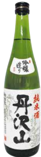
丹沢山【吟醸造り純米酒】 720ml 1,595円