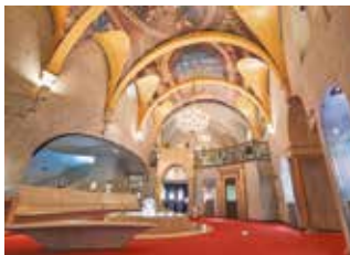
貴族の館を模した「ヴェネチアン・グラス美術館」

日本初のヴェネチアン・グラス専門の美術館。広い園内に「ヴェネチアン・グラス美術館」と「現代ガラス美術館」があります。併設のレストランでは、うかいブラスリーググループ総料理長監修の本格メニューが味わえます。