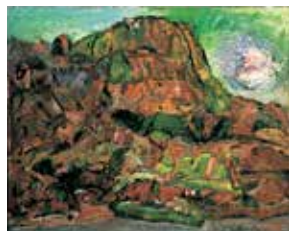
中川一政《駒ヶ岳》油彩・キャンバス、1982年(89歳)真鶴町立中川一政美術館蔵

📍 足柄下郡真鶴町真鶴 1178-1 ☎ 0465-68-1128 🕒 10:00～16:00(入館は15:30まで) 料 大人(一般)600円ほか 🗓 水・木曜(開館カレンダーに準ずる)