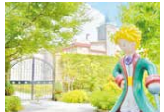
園内には王子さまの像も

📍 足柄下郡箱根町仙石原 909 ☎ 0460-86-3700 🕒 10:00～18:00(入園は17:00まで) 料 大人1,600円ほか 🗓 第2水曜、2023年1月10日(火)～1月12日(木)、2023年3月は無休 Le Petit Prince™ Succession Antoine de Saint-Exupéry Licensed by (株) Le Petit Prince™ 星の王子さま™