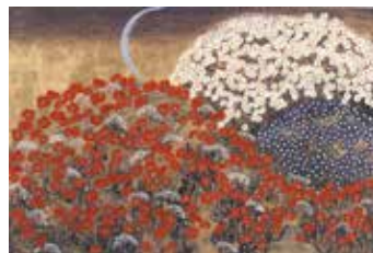
平松礼二《路・ノルマンディの月》岩絵具、金箔・麻紙、1997年

万葉公園近くにあり、現代日本画家・平松礼二をはじめ、近代日本画の大家・竹内栖鳳や洋画家・安井曾太郎ら湯河原ゆかりの画家の作品約400点が所蔵されています。地元の豆腐屋・十二庵プロデュースの併設カフェでは足湯も楽しめます。