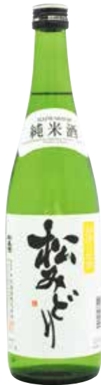
松みどり 純米酒 720ml 1,430円