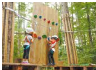
フォレストアドベンチャー・小田原