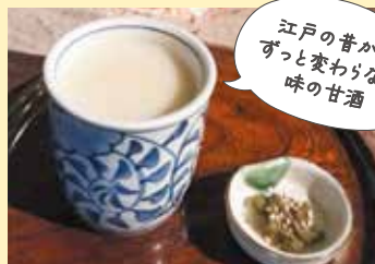
甘酒 1杯 400円

江戸時代から続く老舗。栄養満点、ノンアルコール。砂糖なしでもやさしい甘みの甘酒でエネルギーチャージ!