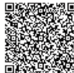
QR code for smartphone

For details, visit the Cabinet Secretariat Civil Protection Portal Site http://www.kokuminhogo.go.jp/