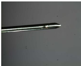
図1 ガラス化保存器具の先端 ステンレス製の針の上で ガラス化保存する。

注) Hepes-TCM199：市販の細胞培養液に緩衝剤を添加、EG：エチレングリコール、Tre：トレハロース