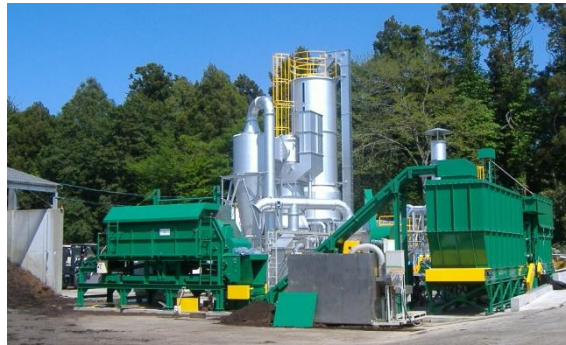
図1 バイオマス燃料装置の外観