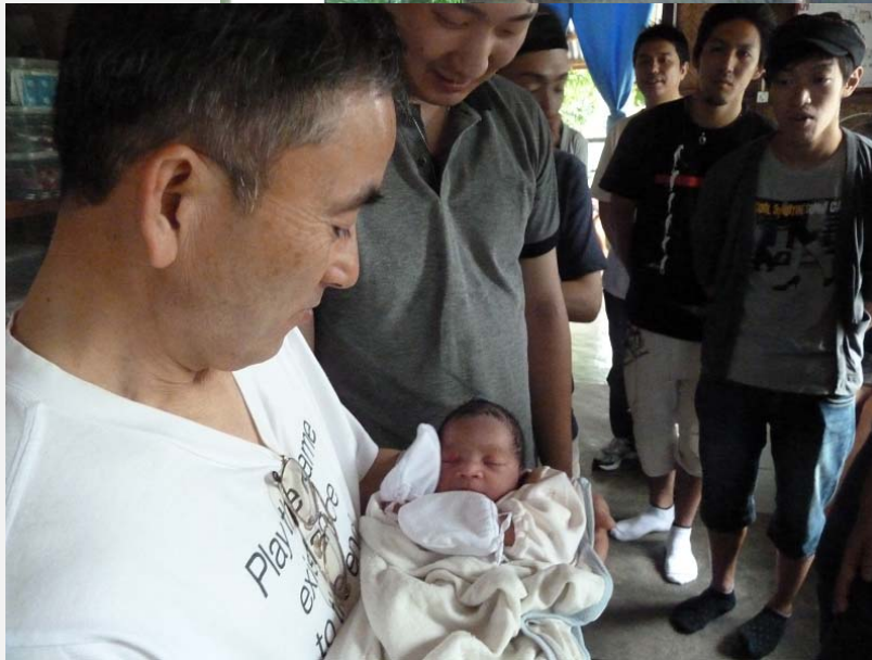
女性の安全な出産を支援する活動