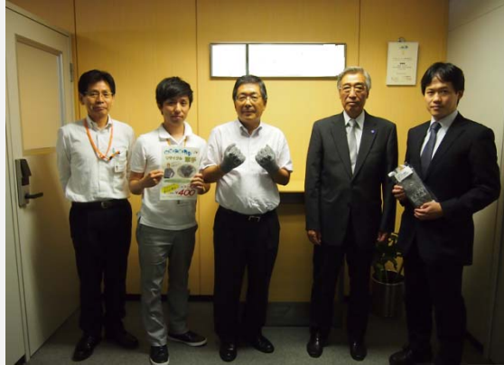
企業イメージの向上に