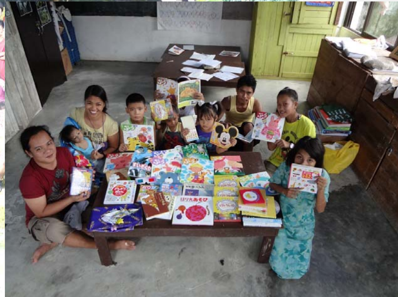
虐待児童の就学を支援する活動