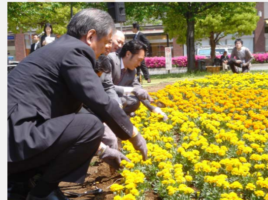
園芸・ガーデニングに