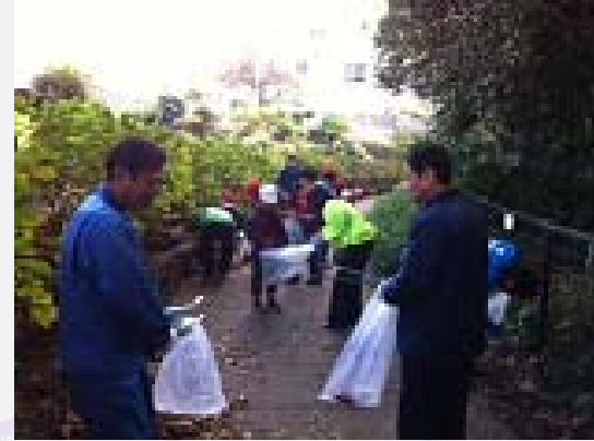
地域の清掃活動に