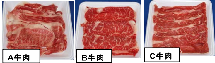
図1 調査に用いた品質の異なる牛肉