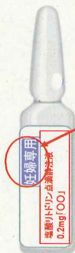
リトドリン塩酸塩（注射薬）のデザイン例