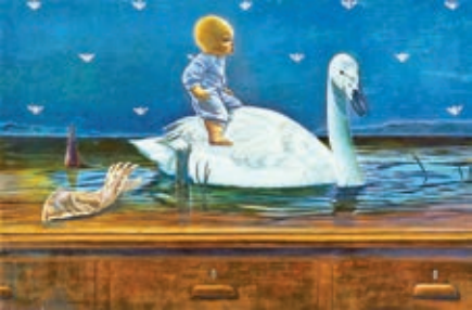
川口起美雄《机の上の旅》2025年 テンペラ、油彩、板 個人蔵