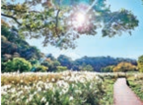
令和7年10月号掲載「小網代の湿原」