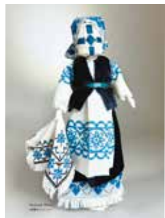
Kozrynyak Oksana ©愛雑きプロジェクト