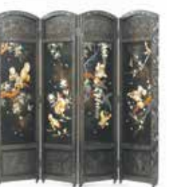
芝山細工花鳥図屏風 昭和45年 中小企業支援課 小田原駐在事務所(工芸技術所)所蔵