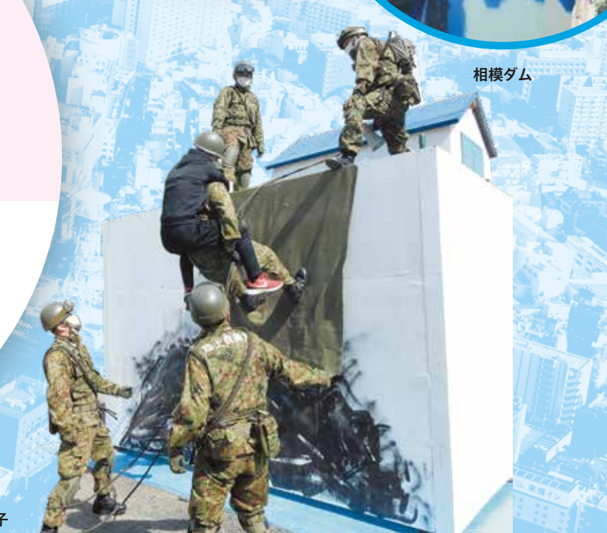
ビッグレスキューかながわにおける救出救助訓練の様子