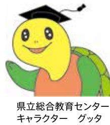
県立総合教育センターキャラクター グッタ