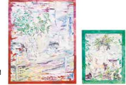
第58回 平面立体部門 大賞作品

神奈川県美術展作品募集 ●搬入日程:工芸・書・写真・中高生 7月6・7日 ●平面立体 7月13・14日 いずれも10～16時 ●場所:神奈川県民ホール ※出品料、応募要項等詳しくは HP か問合せ 📍同展委員会事務局 ☎045(662)5901か県文化課 ☎045(210)3808