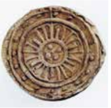
湘南新道出土軒丸瓦