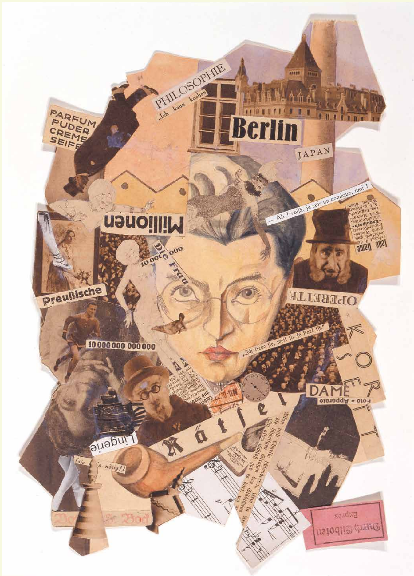
和達知男《謎》1922年頃 県立近代美術館蔵