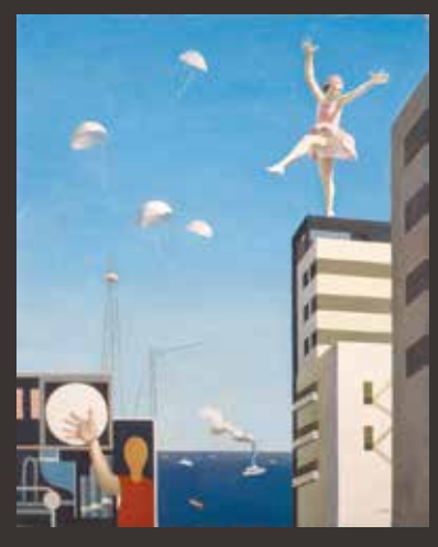
古賀春江(窓外の化粧)1930年 県立近代美術館蔵