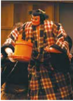
義経千本桜