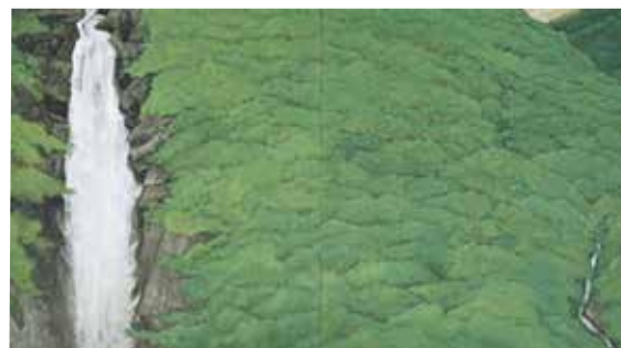
莊司福《山響》1990年 県立近代美術館蔵