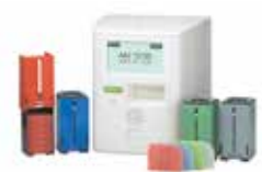
ロボットの一例(薬の飲み忘れや飲み間違いを防止する服薬支援ロボ)