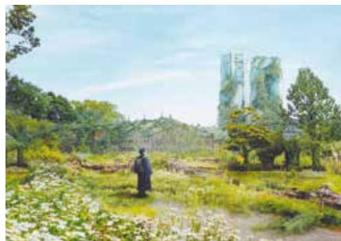
第57回 写真部門大賞作品