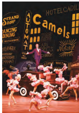
写真は過去の公演より

日程 ▶4月25日～7月22日 KAAT神奈川芸術劇場 定員 ▶各回1100人(3歳未満入場不可) 料金 ▶レギュラー料金1万2000円～4500円(曜日別料金設定あり) 申込み ▶電話かHPでチケットかながわ ☎(0570)015415 へ ※チケット以外の問合せは劇団四季 ☎(0570)008110 か県文化課 ☎045(210)3804