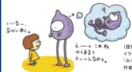
(提供)アリス館 イラスト出典: 『みえるとか みえないとか』 作者:ヨシタケシンスケ