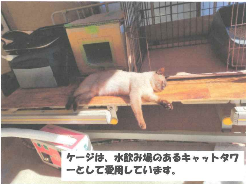
ケージは、水飲み場のあるキャットタワーとして愛用しています。