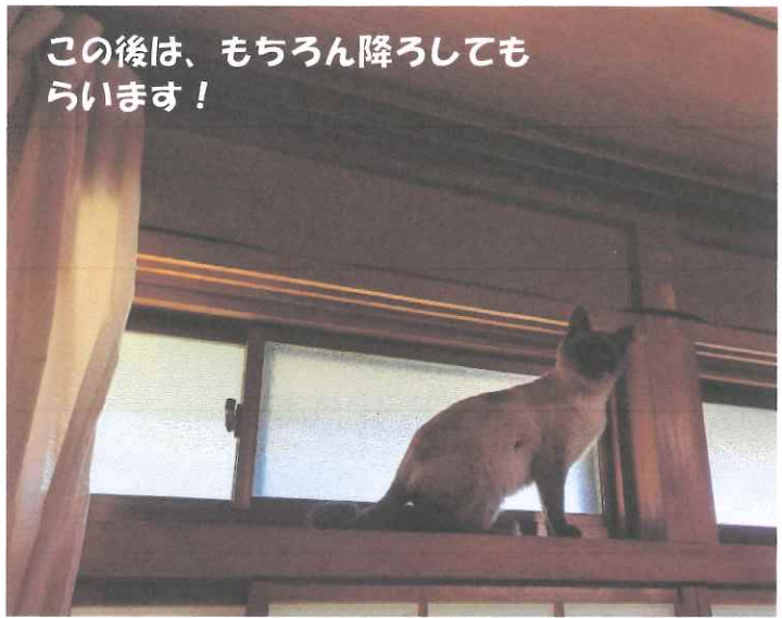
この後は、もちろん降ろしてもらいます!