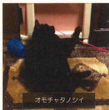
オモチャタノシイ