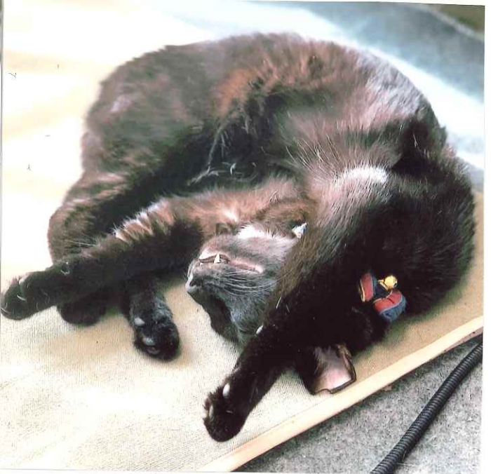
▲ こんなにくつろいでくれるとは!!