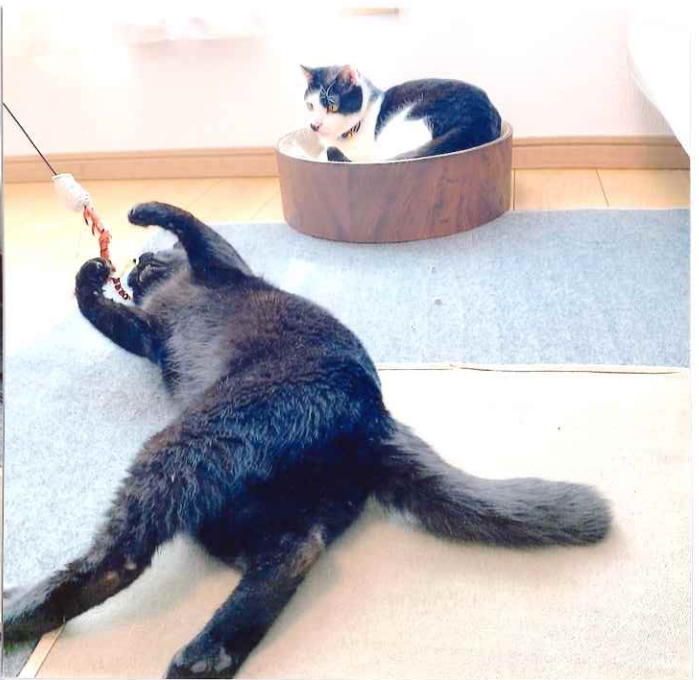
▲ ホットカーペット とバリバリボウリングが人気です 😊😊