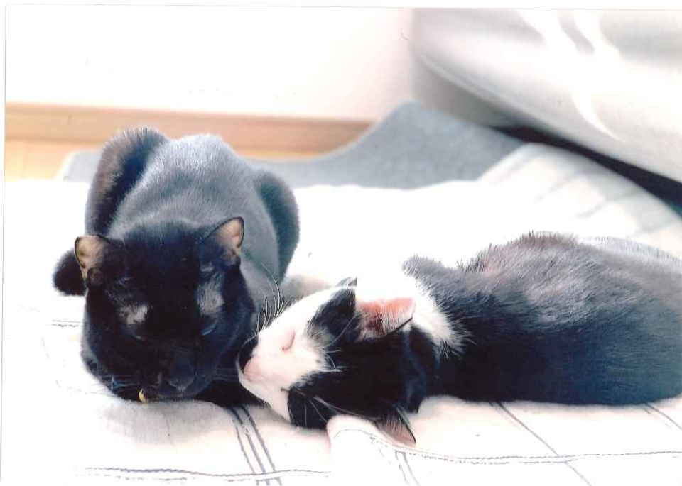
▲ ニャルソックは欠かせません