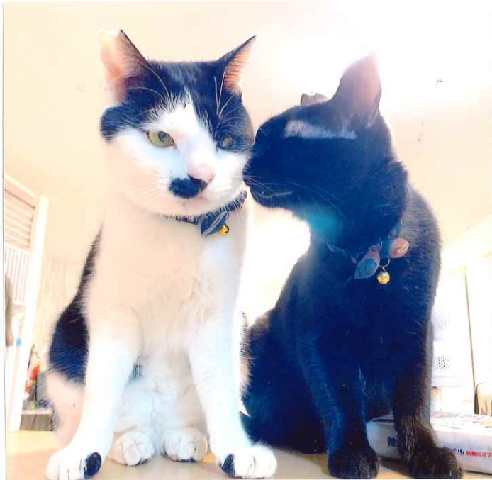
◀ キッチンカウンターにて 仲良く お料理チェックします たまに？ 盗まれますが...