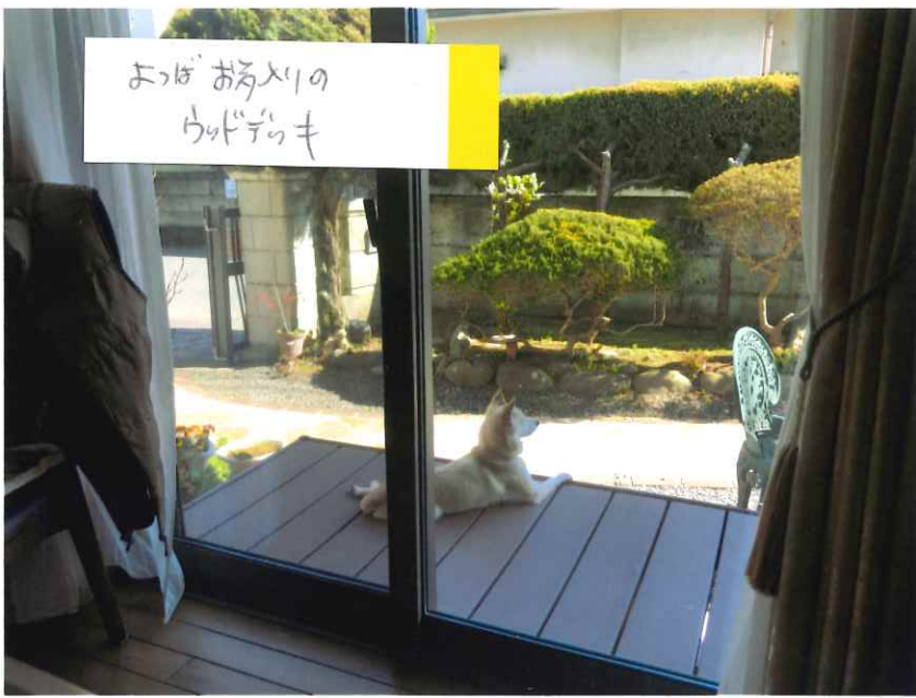
よっほ お帰りの ウチの犬