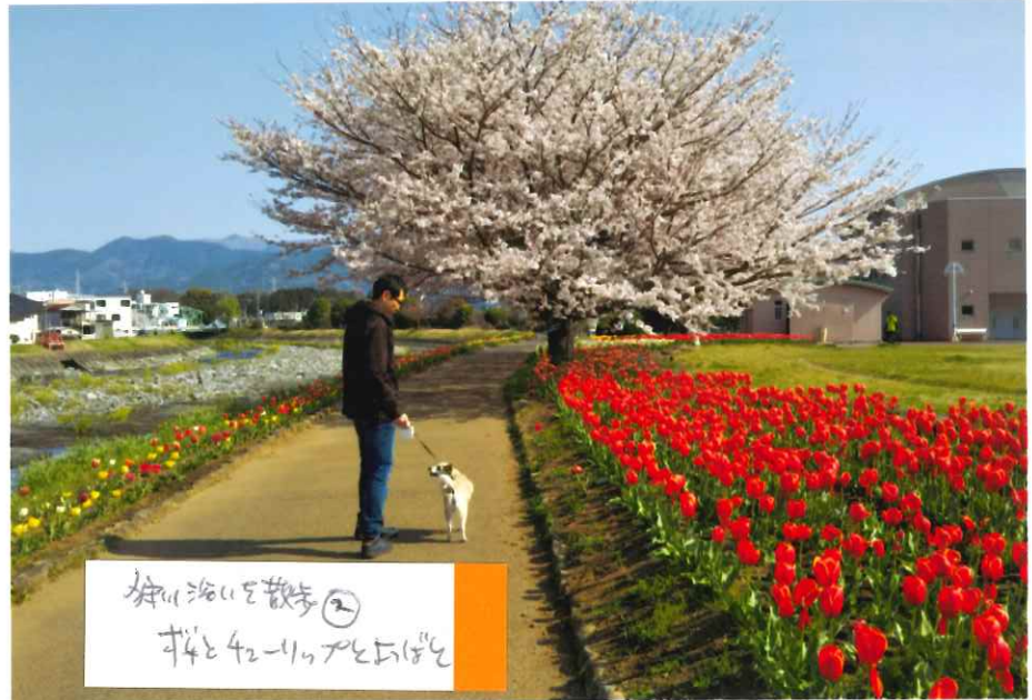
桜川沿いの散歩② 4月24日 11時 5分