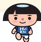
神奈川県PRキャラクター かながわキンタロウ