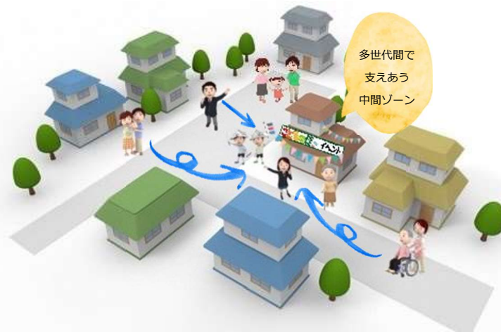
多世代間で 支えあう 中間ゾーン

住宅地の空き家を一軒まるごと中間ゾーンとして活用するタイプです。近隣の住人が気軽に立ち寄れる場所が作り出すことでコミュニティの活性化を図れます。