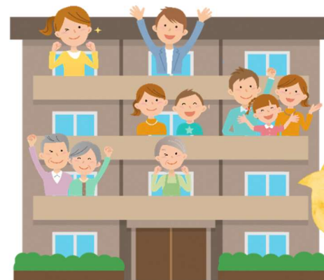
多世代間で 支えあう ゾーン

中間ゾーンや地域支援ゾーンを備えた集合住宅のタイプです。既存のマンションを改修するものがタイプ 3、新築するものがタイプ 4 となります。