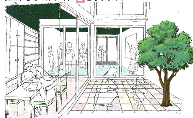
タイプ 2 のイメージ

中間ゾーンを備えたシェアハウスのタイプです。 既存の戸建ての住宅を改修するものがタイプ 1 新築するものがタイプ 2 となります。