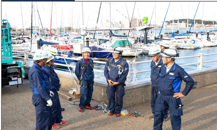
現場での写真です