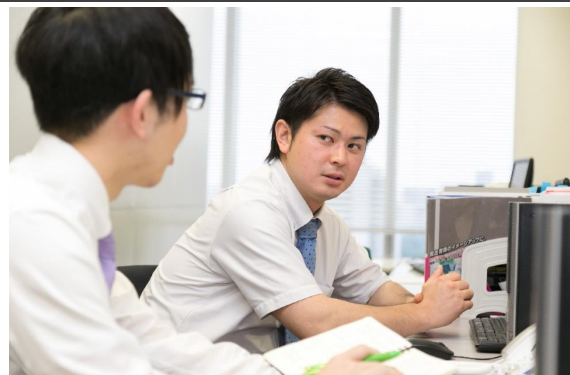
新卒・中途関係なく分からないことは先輩社員に聞ける環境です