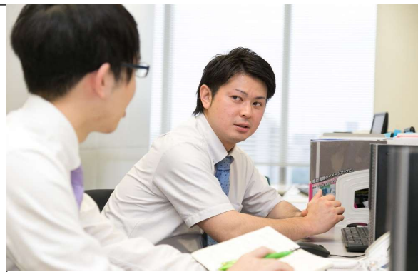
新卒・中途関係なく分からないことは先輩社員に聞ける環境です