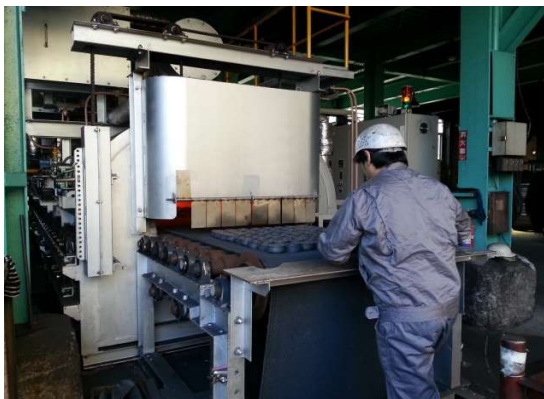
金属熱処理・一般作業作業風景