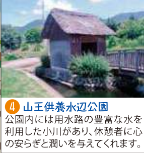
4 山王供養水辺公園 公園内には用水路の豊富な水を利用した小川があり、休憩者に心の安らぎと潤いを与えてくれます。