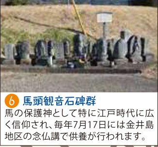
6 馬頭観音石碑群 馬の保護神として特に江戸時代に広く信仰され、毎年7月17日には金井島地区の念仏講で供養が行われます。