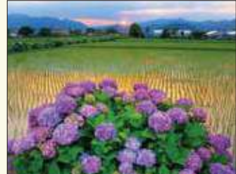
あじさいの里 広大な田畑を基盤の目のように区切る農道や水路に沿って5千株ものあじさいが植えられています。遠くに見える富士山と咲き誇るあじさいのコントラストは見事。