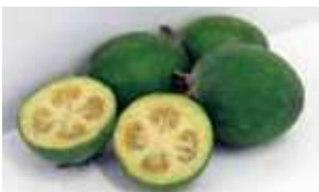
【詳しく知りたい方は】 「あしがら旬感スイーツ」で検索 (大井町HP)

「フェイジョア」は、南米原産で見た目は梅、味と香りはパイナップルに似ているフルーツ。地元ではかつてみかんに次ぐ生産量を期待されましたが、思うように人気が出ませんでした。そんなフェイジョアに目を付けたのが、町内のシェフや菓子職人。フェイジョアを使ったケーキやまんじゅうなどを次々に開発すると大好評に。新しいご当地スイーツを、ぜひ味わって。