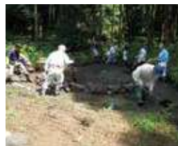
【詳しく知りたい方は】 「ゆめの里育て隊」で 検索(大井町HP)

かつて荒廃しつつあった山林を、花が咲き乱れる夢のような里山に変身させたのは、地元住民の地元愛とパワーでした。その名も「ゆめの里育て隊」。約19ヘクタールもの広大なエリアに広がる、冒険心をくすぐる散策路やバラエティ豊かな花木の植生は、彼らの自由なアイデアと驚くべき団結力による「手づくり」！ まるで里山のテーマパークのようなこの園は、実は今なお進化中。次に訪れたときには、新しい「何か」ができていないかも。歩くだけでは物足りない人は、「ゆめの里育て隊」に一度参加してみては？