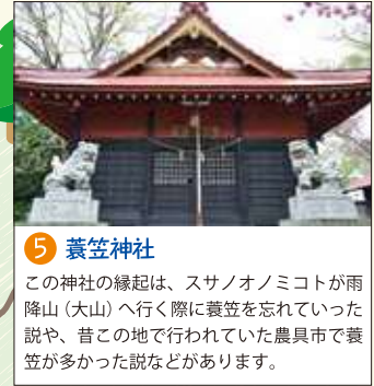
5 蓑笠神社 この神社の縁起は、スサノオノミコトが雨降山(大山)へ行く際に蓑笠を忘れていった説や、昔この地で行われていた農具市で蓑笠が多かった説などがあります。