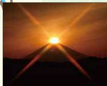
ダイヤモンド富士 富士山頂に太陽が重なる瞬間、ダイヤモンドのように輝く現象です。中井中央公園と海の風で4月と9月の日没の時間帯に見ることができます。