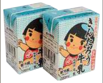
あしがら乳業 神奈川県産生乳を使った「きんたろう牛乳」などを製造しています。こども向けの工場見学もあります。 【電】045-361-1141