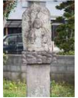
上井ノ口の大山道道標

大山道とは、各地から庶民の信仰の対象とされた大山にある阿夫利神社へ参詣者が通った古道の総称。大山街道とも呼ばれます。町のあちこちで眺められる大山を見ながら、昔の人が歩いた道を辿ってみるのも面白いでしょう。