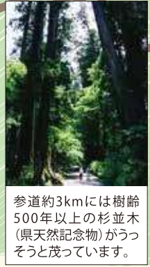
参道約3kmには樹齢500年以上の杉並木(県天然記念物)がうっそうと茂っています。

ジオサイトって？ 箱根火山を中心とした地域の自然や歴史、文化、食などを大地とのつながりを楽しむ「箱根ジオパーク」の見どころです。