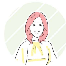
茅ヶ崎市 スタッフ