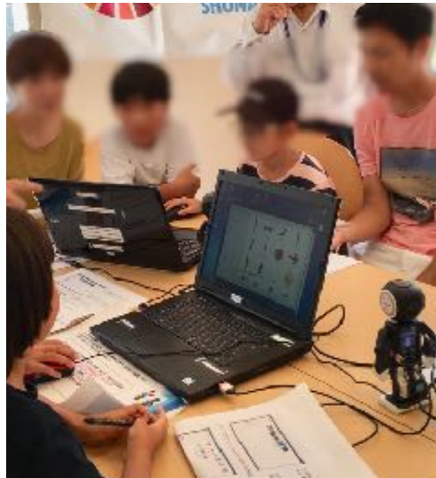
世界を広げる講座