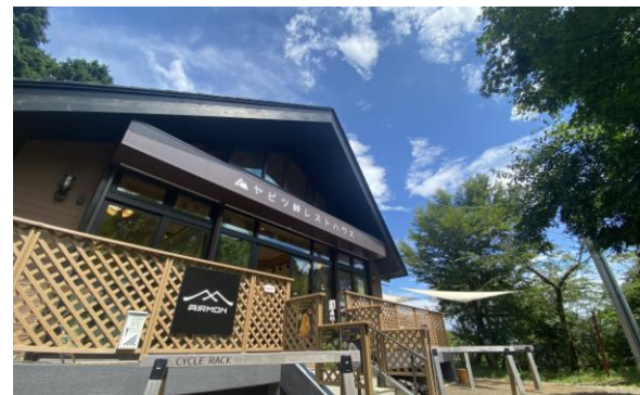
ヤビツ峠レストハウス