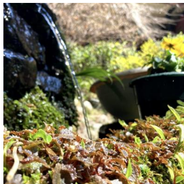
春嶽（はるだけ）湧水