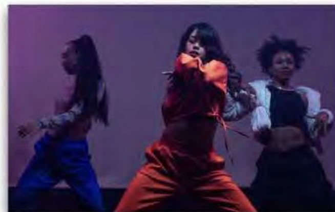
古着ダンスショー