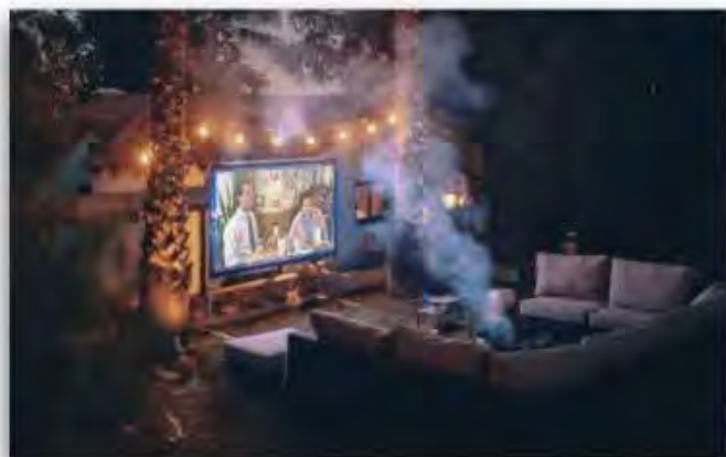
五感で感じるブース出店