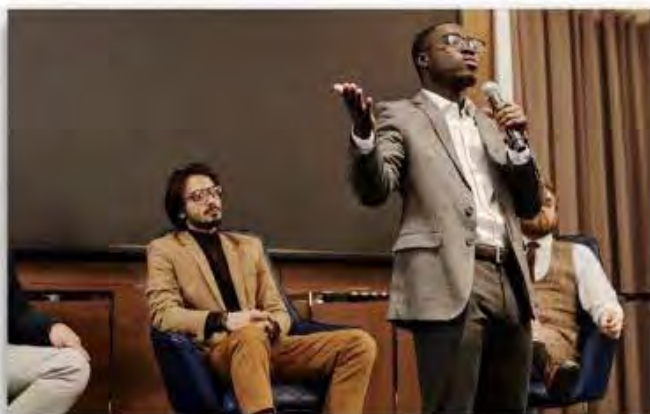
プロジェクト発表