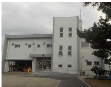
A 大磯港管理事務所