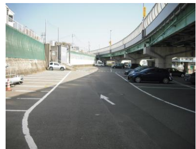
F 臨港道路附属駐車場 (第1駐車場)