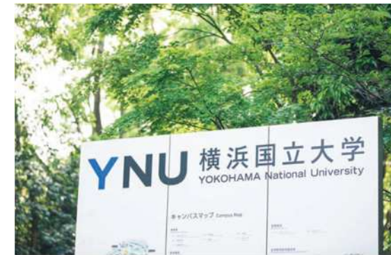
(写真) 横浜国立大学キャンパス