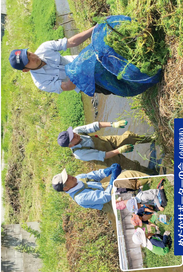
めだかサポーターの会 (小田原市)