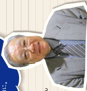
シニアネットワークおたわら&あしがら