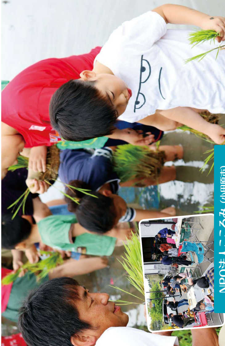
NPO法人こころみ (小田原市)