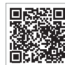
新型冠状病毒感染症专用电话