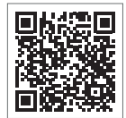
神奈川小儿急救电话