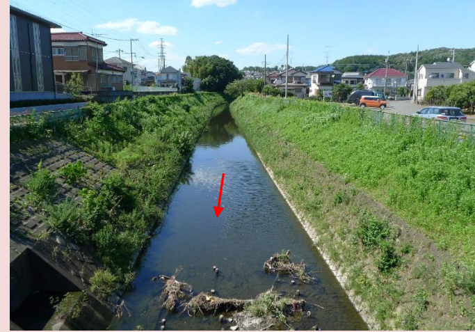
共和橋上流（改修前）

管理する区間のうち下流域においては、平成20年8月末豪雨で溢水被害が発生した「共和橋」付近を含む「根岸橋」から「馬場橋」までの区間の護岸整備を進めています。