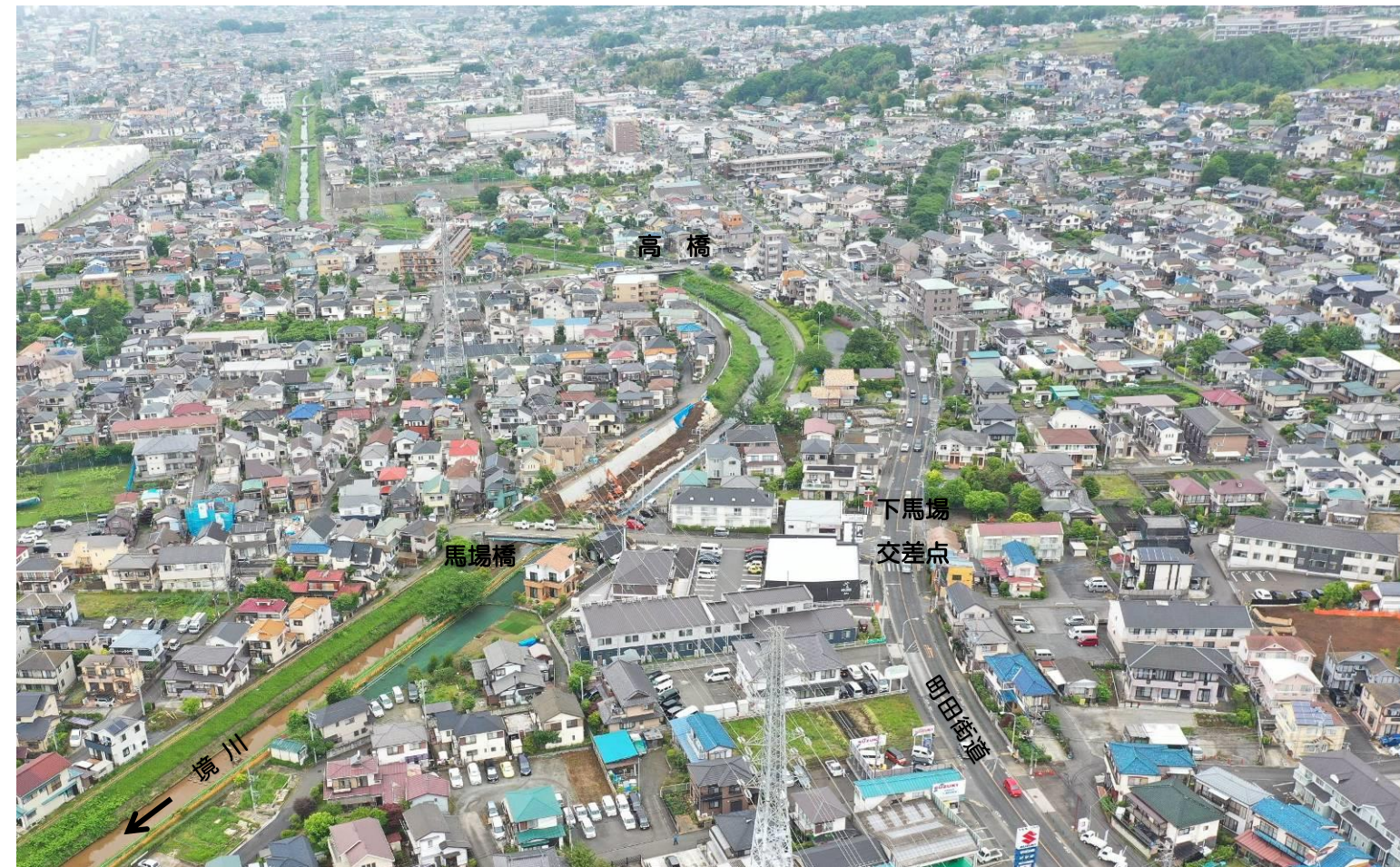
改修工事の状況（馬場橋上流）令和4年5月撮影