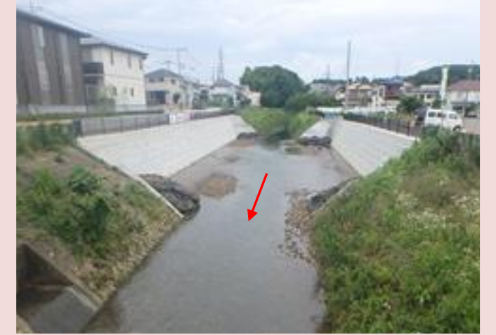
共和橋上流（改修後）