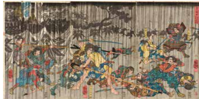
「富士裾野曾我兄弟本望遂図」歌川国芳 所蔵：神奈川県立歴史博物館

今から800年ぐらい昔の鎌倉時代、大きな運命を背負った2人の若者、曾我十郎・五郎の兄弟の伝説は、「曾我物語」として、江戸時代を中心に多くの人々に親しまれてきました。「曾我物語」の舞台である神奈川県西部には、今も兄弟にまつわる史跡が数多く残されています。また、「曾我物語」は、さまざまな文学作品や絵画に描かれ、今日ご紹介するように、数多くの芸能にも取り上げられたのです。今、時を超えて、この小田原三の丸ホールに、伝説の兄弟がよみがえります！さあ！われらがヒーロー・曾我兄弟に会いに来てください！