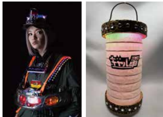
講師による完成例