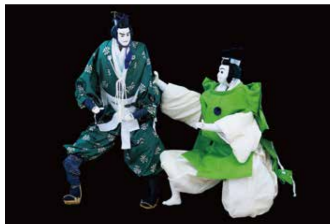
相模人形芝居下中座

神奈川県内に伝わる人形芝居と地域の人々が演じる歌舞伎の中から、曾我兄弟の仇討を題材とする演目をお楽しみください。