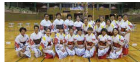
足柄ささら踊保存会