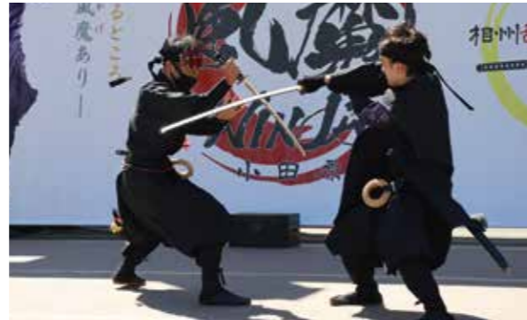
新型コロナウイルス感染症などの状況により急きょ変更、中止する場合があります

戦国時代、小田原北条氏を影で支えた伝説の忍び集団・風魔忍者の活躍を描くアクションショー。 開催日時 令和5年2月19日(日)、23日(木・祝)、26日(日) 上演時間 ①11:00~ ②13:00~ ※雨天・荒天中止(雨天予報の場合、各日前日13:00に開催判断) 開催場所 小田原市観光交流センターにぎわい広場 ※小田原三の丸ホール敷地内 観覧料金 無料(申込不要) 主催・問合せ先 一般社団法人 小田原市観光協会 E-mail: saito@odawara-kankou.com 電話:0465-20-4192