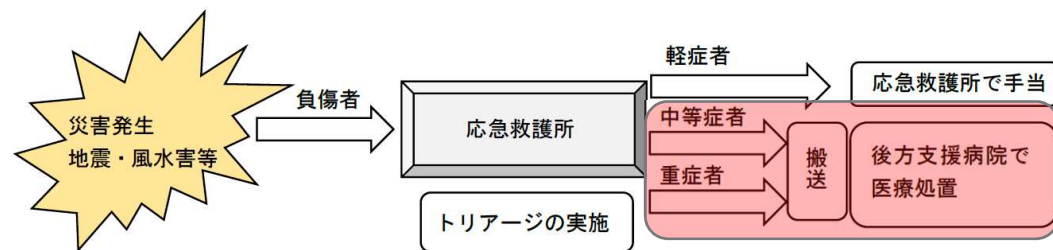
後方支援病院への搬送イメージ図