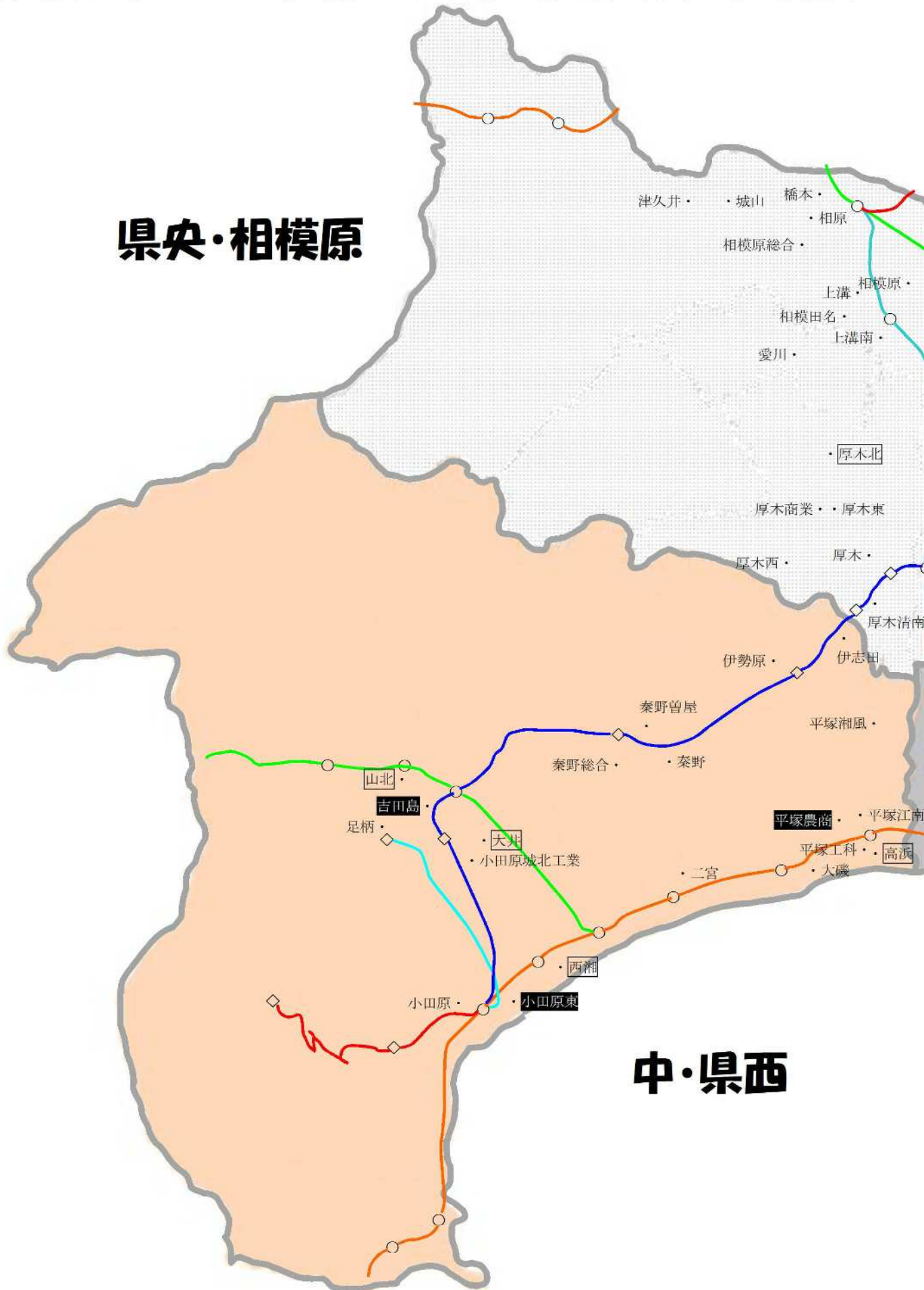
【参考図表1】 5つの地域と現在の公立高校の配置状況（令和4年4月現在）