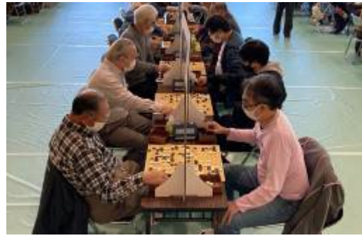
リハーサル大会の様子