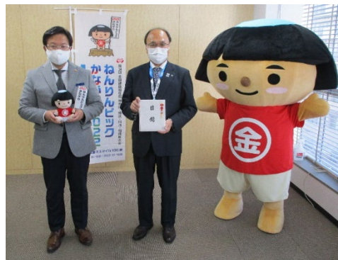
SNSでの協賛企業の紹介（（株）ありあけ）

大会運営を円滑に進めるため、広告協賛金等を広く募集し、8月18日時点で1,910万円分の申込をいただいている。なお、協賛いただいた企業については、SNSでの紹介や大会専用ウェブサイトでのバナー掲示を行っている。