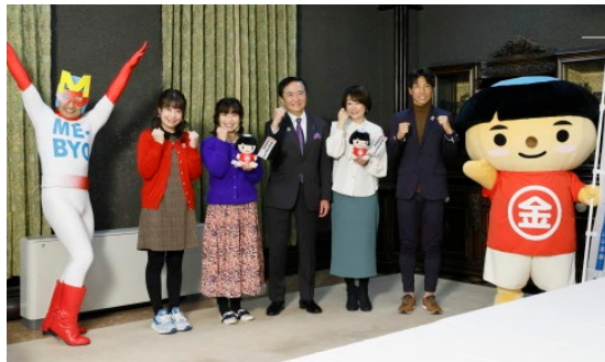
知事と広報キャラバン隊の皆さん