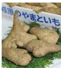
さがみはらのやまといも