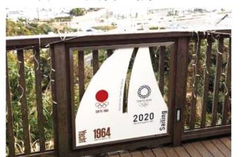
4 中津宮広場ウッドデッキ