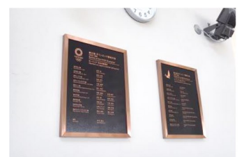
3 湘南港ヨットハウス2階オリンピックメモリアル壁面