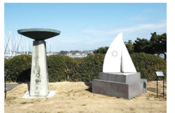
2 湘南港モニュメント及び聖火台の隣