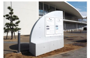
1 湘南港ヨットハウス前

江の島島内に設置されている東京オリンピックの感動と記録を伝える「銘板」4箇所のフォトラリー。カメラやスマートフォンで銘板の写真を撮ってプレゼントを貰っちゃおう♪