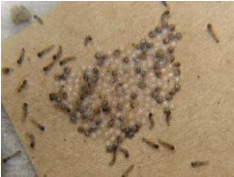
(写真1：ハスモンヨトウ孵化直後)