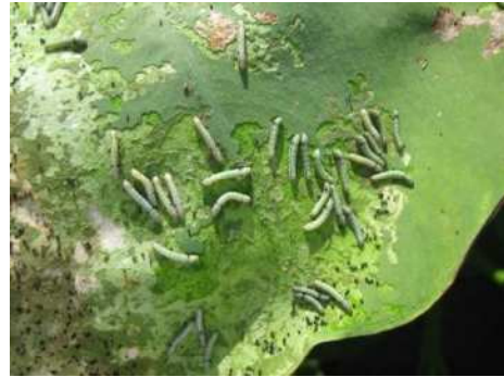
(写真2：ハスモンヨトウ若齢幼虫)